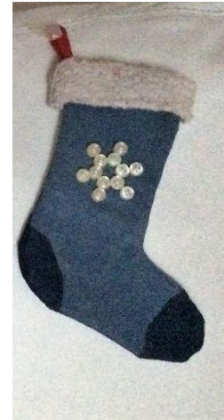
Gauche : Marie Claire idées, novembre décembre 2015, p113 - Haut : livre :Warm Fuzzies: 30 Sweet Felted Projects - Droite : chaussette en jeans avec des boutons et un bord en doublure desweat